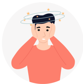
ПРОВАЛЫ В ПАМЯТИ