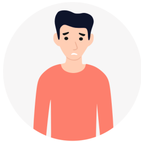
ПОТЕРЯ ИНТЕРЕСА К ЛЮБИМЫМ ЗАНЯТИЯМ