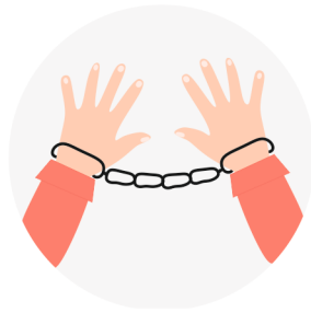
ПРОБЛЕМЫ С ЗАКОНОМ И НА РАБОТЕ

Макет подготовлен ОГБУЗ «Центр общественного здоровья и медицинской профилактики»