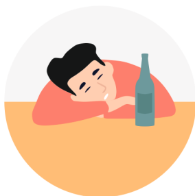
ВЫПИВКА В ОДИНОЧКУ