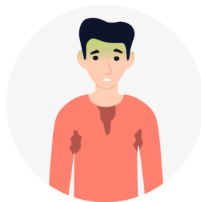
ПРОБЛЕМЫ СО ЗДОРОВЬЕМ