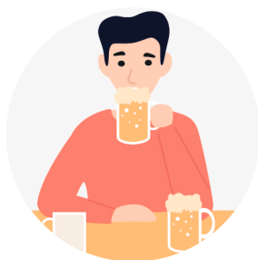
ОТСУТСТВИЕ КОНТРОЛЯ КОЛИЧЕСТВА ВЫПИТОГО